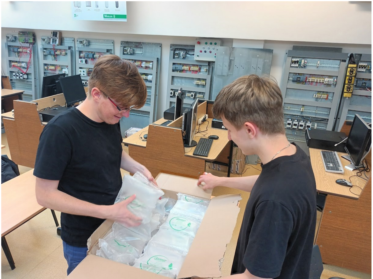
Šok, přišel jen balený vzduch