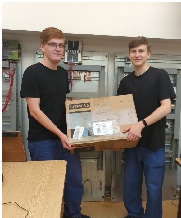
Nečekaně dorazila zásilka oproti avizovanému dodání únor 2023